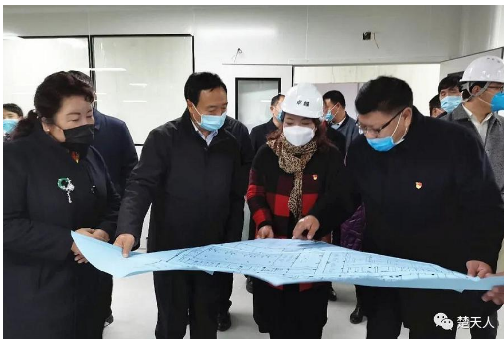
西藏自治区副主席江白（左二）等在工厂查看设计图

(8) 四川省医药设计院承担西藏自治区的首家防护口罩生产工厂——“西藏甘露藏药集团公司”的设计工作。用3天时间完成了工艺平面图设计，10天时间完成了给排水、弱电、暖通等施工图设计。预计4月1日首条生产线就能运行。